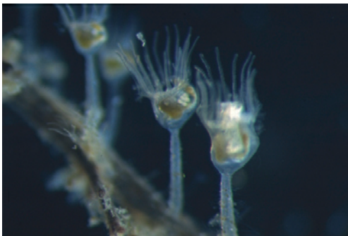
Figuur 1. Pedicellina cernua . Figure 1. Pedicellina cernua .

Wereldwijd zijn zo'n 150 soorten kelkwormen beschreven, maar het totale aantal soorten is waarschijnlijk groter dan 500 (Nielsen 1989). Ze zijn op twee soorten na beperkt tot zee- en brakwater (Wood 2005). Uit Nederland zijn vijf soorten met zekerheid bekend. Ze zijn te vinden onder de laagwaterlijn en verder alleen in het meest lage deel van het getijdengebied, waarschijnlijk omdat ze geen goede bescherming tegen uitdroging hebben. Ze kunnen worden aangetroffen in allerlei watertypen: zee- en brakwater, binnen- en buitenwater, aan beschutte en geëxponeerde oevers. Het is niet eenvoudig gericht materiaal te verzamelen omdat kelkwormen moeilijk met het blote oog te herkennen zijn. Ze zijn